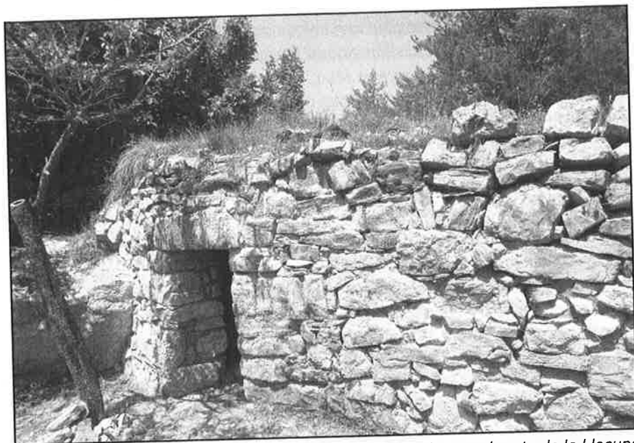
Barraca de cal Masoveret restaurada, vora la ruta de la Llacuna

sigui calcària, conglomerat o gres. Cap de les barraques de Vallcebre és en la mateixa lliga que les barraques de la Garriga d'Empordà, Calafell o de qualsevol comarca on es cultiva la vinya i l'olivera. Representen igualment un fenomen i una època important en la història del municipi.