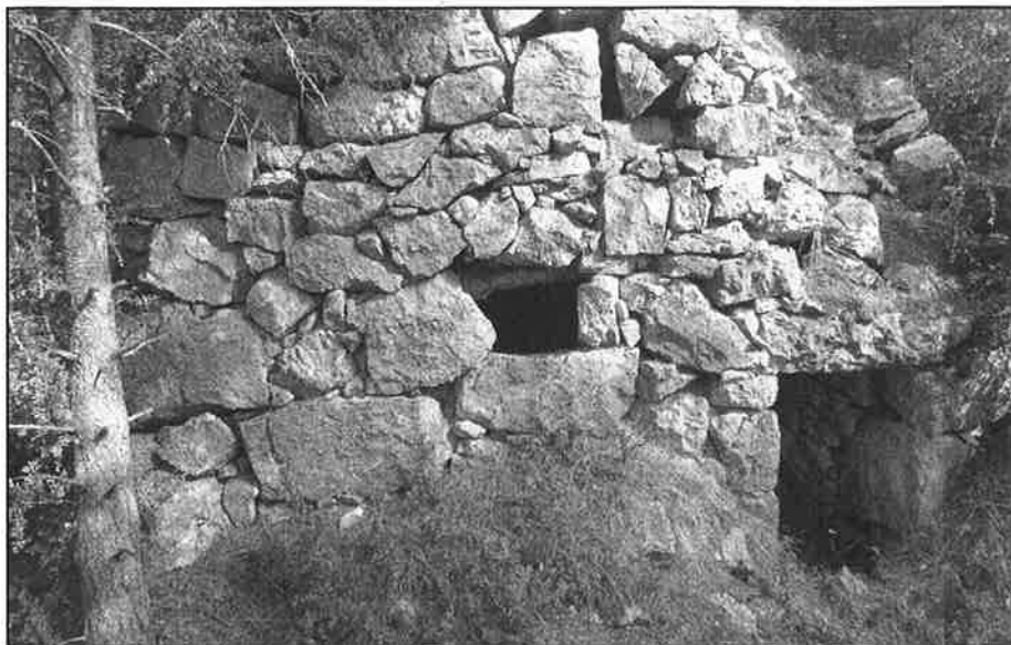
Barraca de cal Tiet

La barraca de pedra seca és una arquitectura popular, de pagesos anònims, alguns més hàbils que els altres. Feien servir la pedra de la zona, que